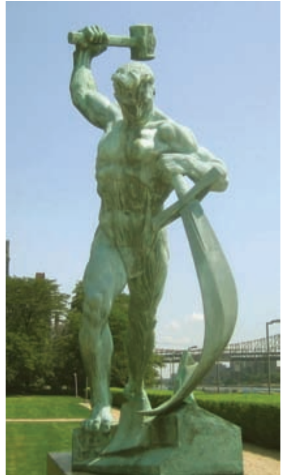
Schwerter zu Pflugscharen: Skulptur am Sitz der Vereinten Nationen, New York