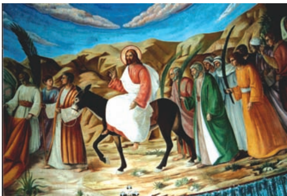
Jesus kommt nach Jerusalem

Er lebte unter uns Menschen als Bruder und Diener. 5 So wies er die Macht anderer Herren in ihre Schranken. Jesus Christus ist jedoch nicht nur der Herr seiner Gemeinde, er ist und bleibt Herr der Schöpfung und der Geschichte. Darum dürfen wir darauf vertrauen, dass sein Weg der Gewaltlosigkeit und der leidensbereiten Liebe uns ans Ziel führt.