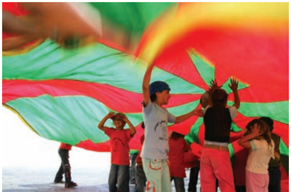
Palästinensische Kinder beim Friedenstanz