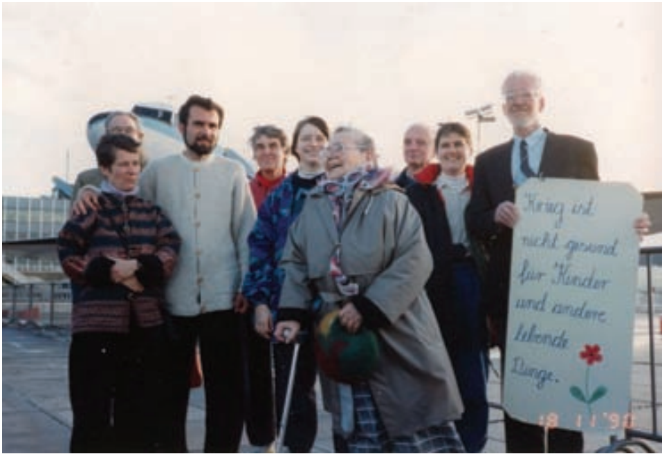
Eine Delegation der „Initiative Frieden am Golf“ am Flughafen Frankfurt vor der Abreise in den Irak im November 1990.